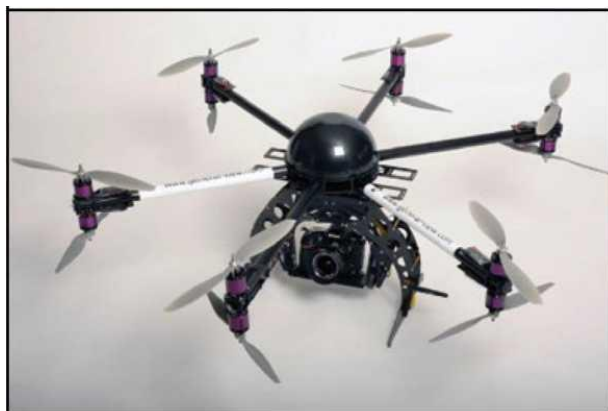
Рис. № 5 - многооторный БПЛА.

Тип БПЛА, который с каждым днем получают все большее распространение, - многооторные системы. Их еще называют мультикоптерами, квадрокоптерами, гексакоптерами, октакоптерами и тому подобное, в зависимости от количества несущих винтов. Характерная особенность - многооторная система, принцип полета - подобен вертолетному (рис. № 5).