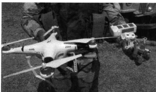
Рис. № 1 - БВС вертолетного типа.

Для совершения диверсионных актов могут использоваться БВС самолетного и вертолетного типа (рис. № 1) кустарного производства, причем доля последних значительно превышает количество самолетных. Объясняется это в первую очередь их более низкой стоимостью.