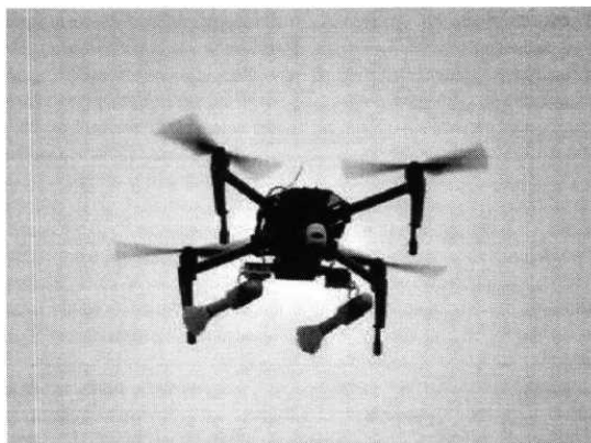
Рис. № 3 – квадрокоптер.

На квадрокоптерах также изменяется система управления камерой таким образом, чтобы над целью вытягивать леску и высвободить гранату. Корпус может быть пластмассовый и снабжен небольшим количеством поражающих элементов. Основу для самодельных бомб могут составить переделанные фабричные боеприпасы. Например, выстрелы ВОГ-17А и ВОГ-17М. Также используются безгильзовые гранаты ВОГ-25. Взрыв ВОГ сравним со взрывом ручной гранаты РГД-5. При взрыве ВОГ-25 образуется большая масса мелких осколков, которые обеспечивают сплошное покрытие осколками в радиусе 10 метров. При таком взрыве все не защищенные участки тела поражаются осколками.