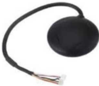
Рис. № 8 - Модуль GPS-навигации.

Рассмотрим радиопередающие системы, установленные на БПЛА.