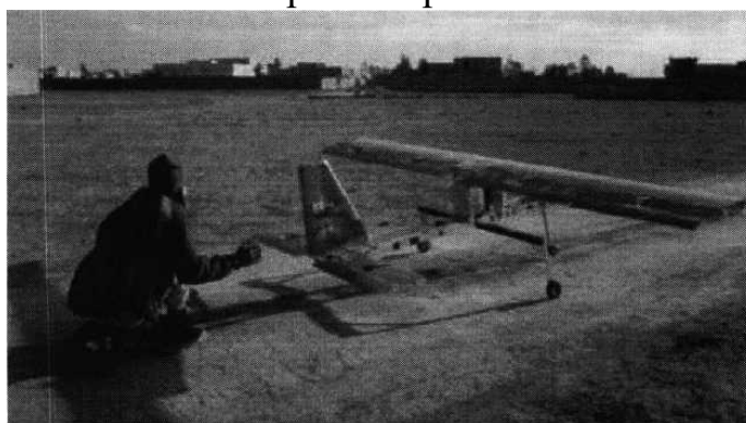
Рис. № 4 - малогабаритный летательный аппарат.

БВС-камикадзе является весьма специфичным классом беспилотной техники, информация о котором чаще всего носит секретный характер. Такой дрон представляет собой малогабаритный летательный аппарат (рис. № 4), способный нести несколько килограмм взрывчатки.