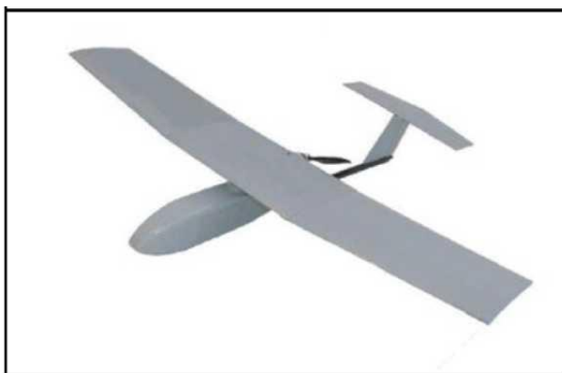
Рис. № 6 – БПЛА самолетного типа.

Существуют БПЛА, предназначенные для выполнения задач РЭР, РЭБ и связи. Скоростной диапазон работы - от 15 до 30 м/с. Рабочие высоты - в зависимости от оборудования и размеров аппарата, но всегда превышают 300 м. Обычно это диапазон высот 300 - 2000 м. Существует несколько аэродинамических схем самолетных БПЛА. Основные аэродинамические схемы – классическая (рис. № 6) и «летающее крыло» (рис. № 7).