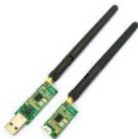
Рис. № 9 - Модем телеметрии.

Модем телеметрии (рис. № 9) - приемное устройство, предназначенное для обмена информацией между наземной станцией и БПЛА. От наземной станции он посылает команды к выполнению, от БПЛА - принимает на наземную станцию информацию, получаемую с датчиков (например, скорость, потребление тока, напряжение, положение в пространстве. Обычно является основным каналом управления БПЛА.