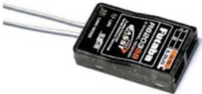
Рис. № 11 - Приемник аппаратуры управления.

Видеопередатчик (рис. № 10) - это устройство, передающее на наземную станцию изображение с камер БПЛА. Является самым заметным устройством на борту БПЛА, поэтому без необходимости включать его не стоит (это касается только тех БПЛА, которые хранят фотографии на борту), соблюдая режим радиомолчания. Такой режим уменьшает возможность применения противником средств РЭБ.