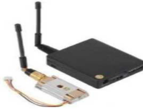
Рис. № 10 - Видеопередатчик.

Видеопередатчик (рис. № 10) - это устройство, передающее на наземную станцию изображение с камер БПЛА. Является самым заметным устройством на борту БПЛА, поэтому без необходимости включать его не стоит (это касается только тех БПЛА, которые хранят фотографии на борту), соблюдая режим радиомолчания. Такой режим уменьшает возможность применения противником средств РЭБ.